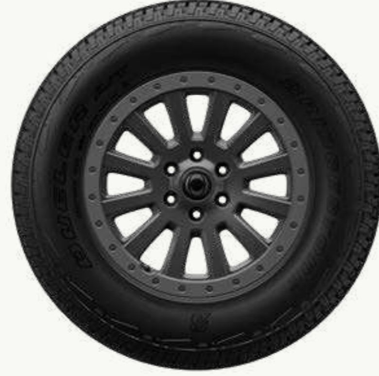
سبائكية مقاس ١٨ بوصة