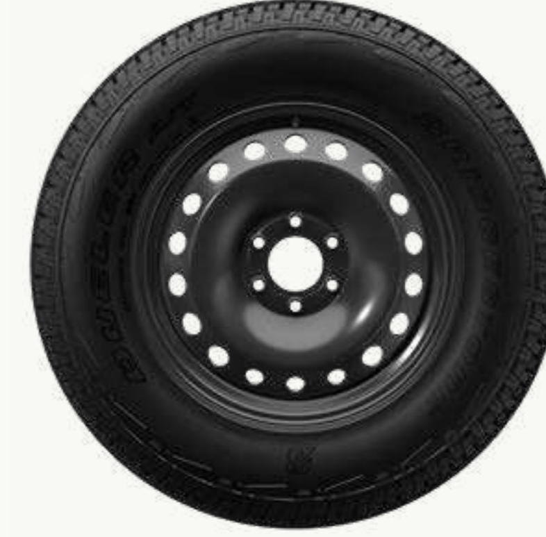
فولاذية مقاس ١٨ بوصة