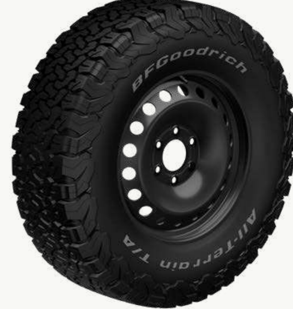
إطار BFGOODRICH ALL-TERRAIN T/A K02