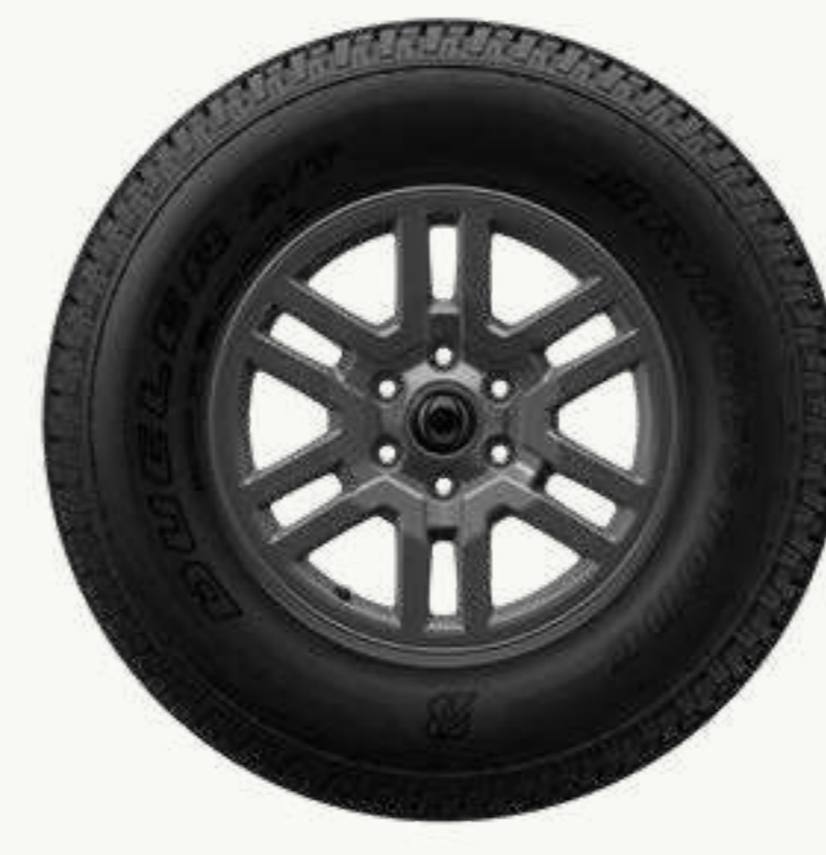
سبائكية مقاس ١٧ بوصة